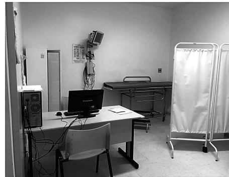
Figura 8: Cuidados médicos na ala ginecológica.