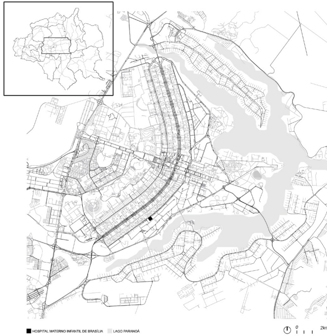
Figura 3: Mapa da Área Metropolitana de Brasília e mapa de localização do HMIB. Elaboração: Ione Almeida, 2021.