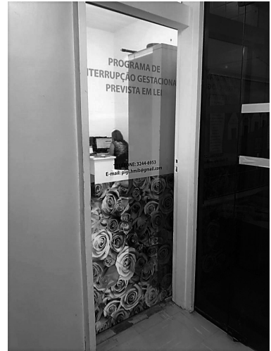
Figuras 5 e 6: Sala de espera no corredor e entrada do programa.