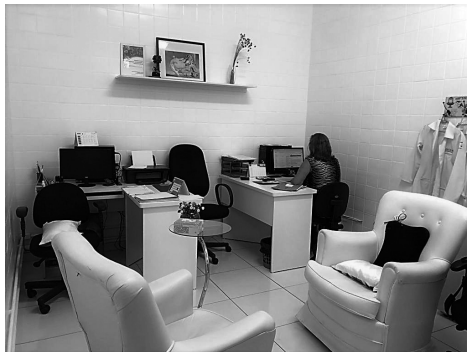
Figura 7: Espaço para acolhimento e cuidados psicossociais.