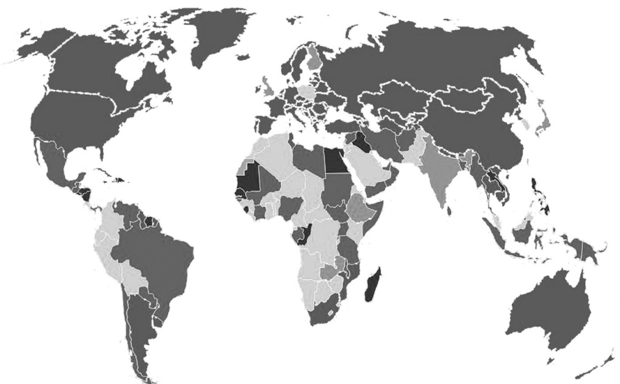
Figura 2: Leis de aborto em todo o mundo.