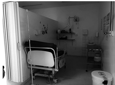
Figura 9 e 10: Box de atendimento compartilhado para parturientes e mulheres em procedimento de aborto. Detalhe: cama de procedimento. Fonte: produção própria, 2019.