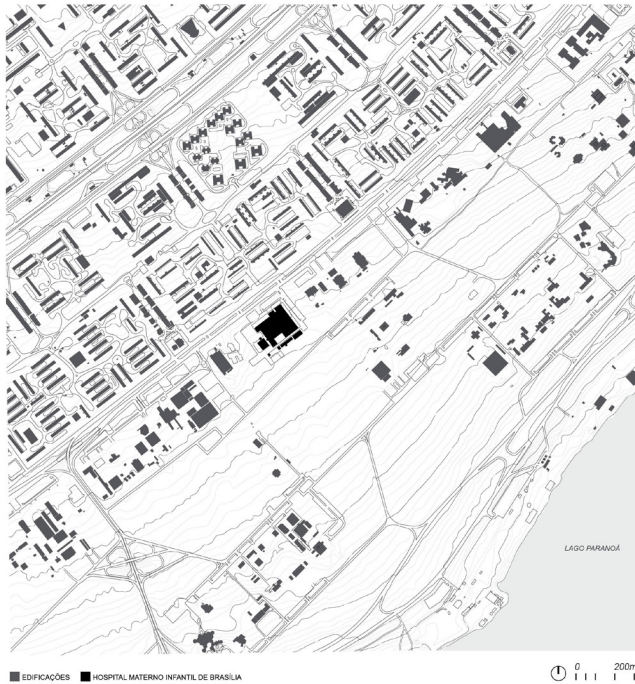
Figura 4: Mapa de localização do HMIB. Elaboração: Ione Almeida, 2021.