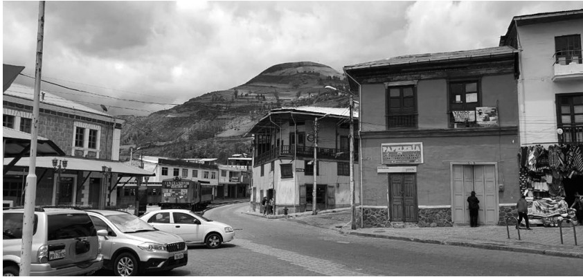
Figura 1: Elementos que conforman el Paisaje Urbano Histórico. El patrimonio edificado de Alausí y los elementos naturales.