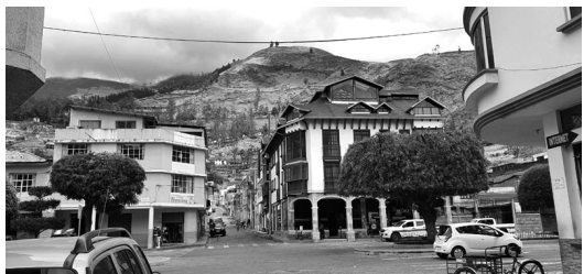
Figura 7: Alausí es el segundo destino en ser parte del Programa Pueblos Mágicos Ecuador - 4 Mundos, a partir de sus singulares atributos naturales y culturales, considerado, además, como ciudad patrimonio del Ecuador.