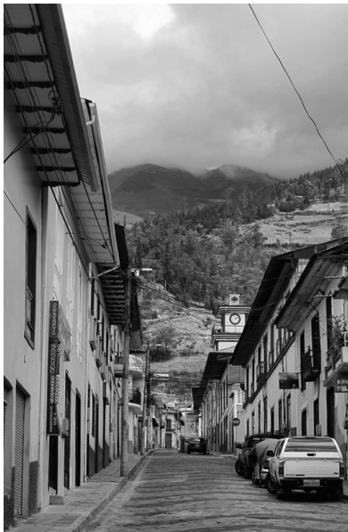
Figura 6: Lo colonial y natural. La arquitectura presente en el centro histórico de Alausí y su paisaje natural como elementos componentes del Paisaje Urbano Histórico.

La gestión y conservación de su PUH responde a una imagen futura con carácter y calidad, en donde prevalezcan los usos tradicionales, los espacios públicos y las áreas verdes como plazas y parques. Esto incluye las visuales propias de su topografía, miradores y colinas.