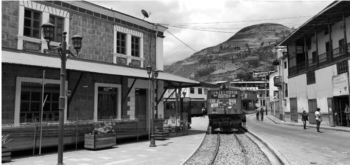
Figura 4: El ferrocarril. El ferrocarril como uno de los cinco patrimonios que conforman el Paisaje Urbano Histórico de Alausí.