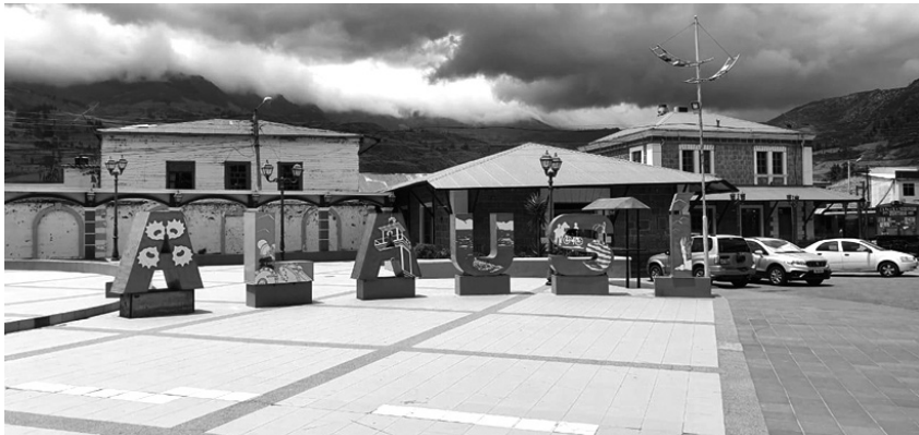
Figura 2: Acceso a la ciudad de Alausí. Identificación de la ciudad de Alausí.