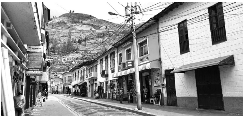
Figura 3: La trama urbana, el patrimonio edificado y el patrimonio natural. Las vías y aceras que conforman la trama urbana que con las diferentes edificaciones y su paisaje natural conforman el Paisaje Urbano Histórico de Alausí como Pueblo Mágico del Ecuador.