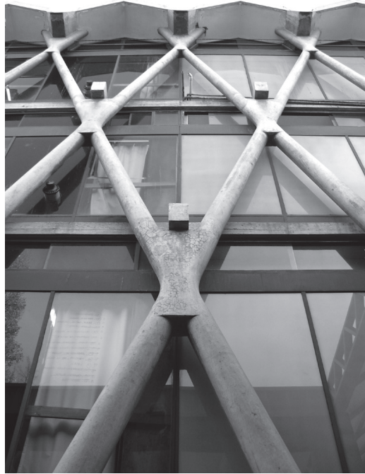
Figura 3: Publicación del edificio de la Facultad de Arquitectura de Mendoza.