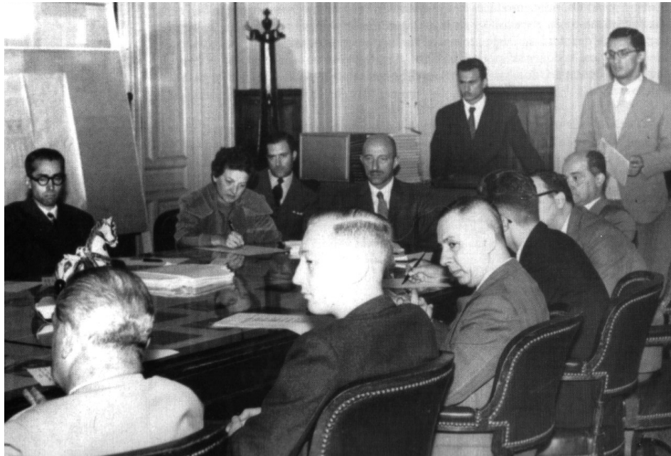
Figura 2: Reunión de docentes en el Encuentro de Docentes de Historia de la Arquitectura, Tucumán (1957).