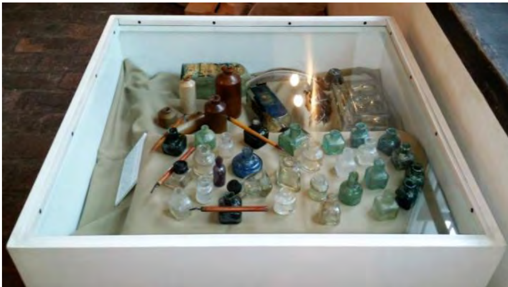
Vitrina de tinteros y objetos de escritura