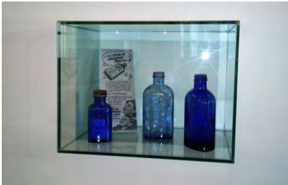
Frascos de leche de magnesia Phillips