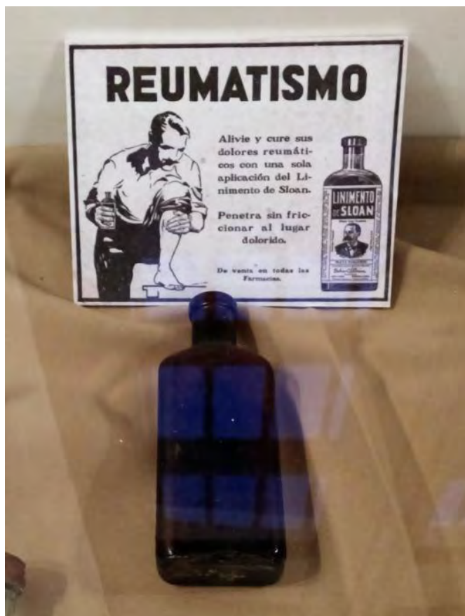
Medicina contra el reumatismo