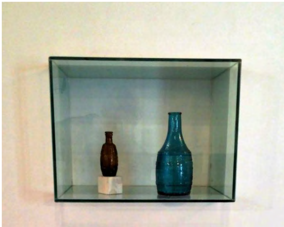
La belleza de los frascos con forma de barril y sus variedades.