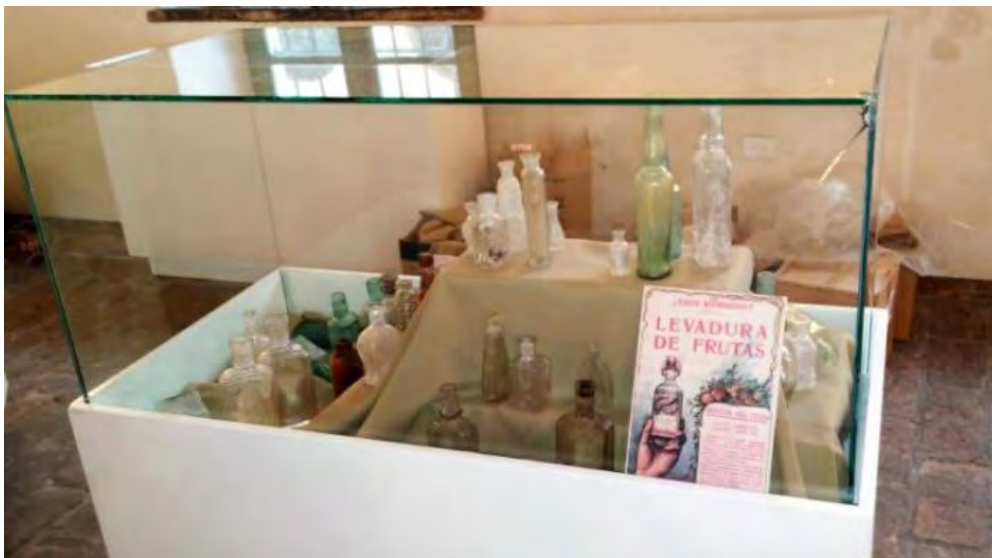
Vitrina con frascos para la belleza interior y exterior