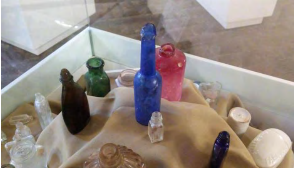
Vitrina con productos de tocador.