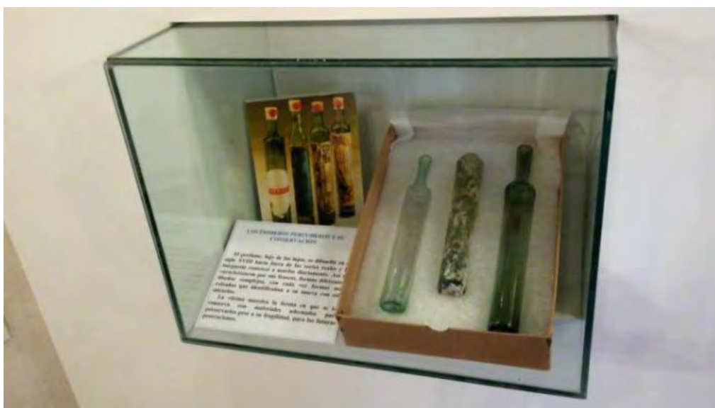
Perfumeros de inicios del siglo XIX