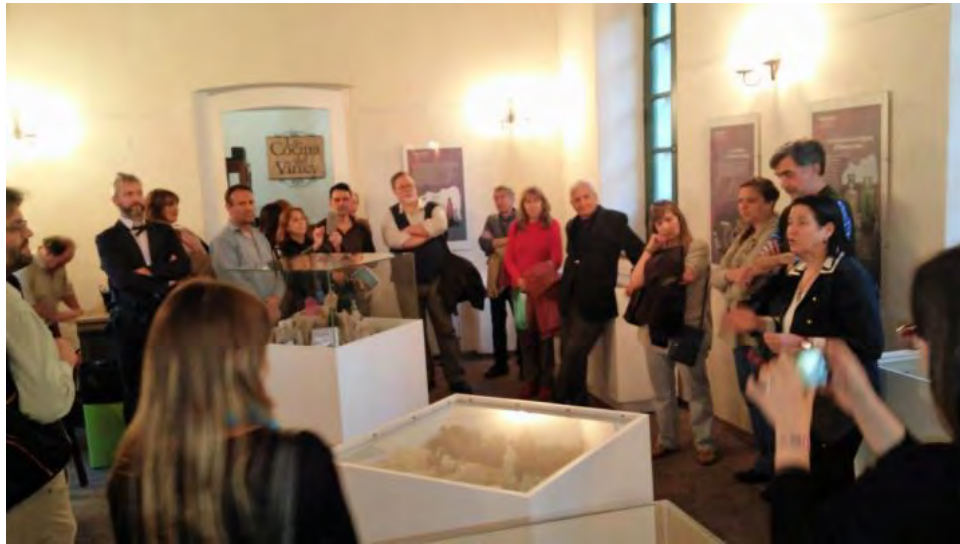
Acto de inauguración de la exhibición