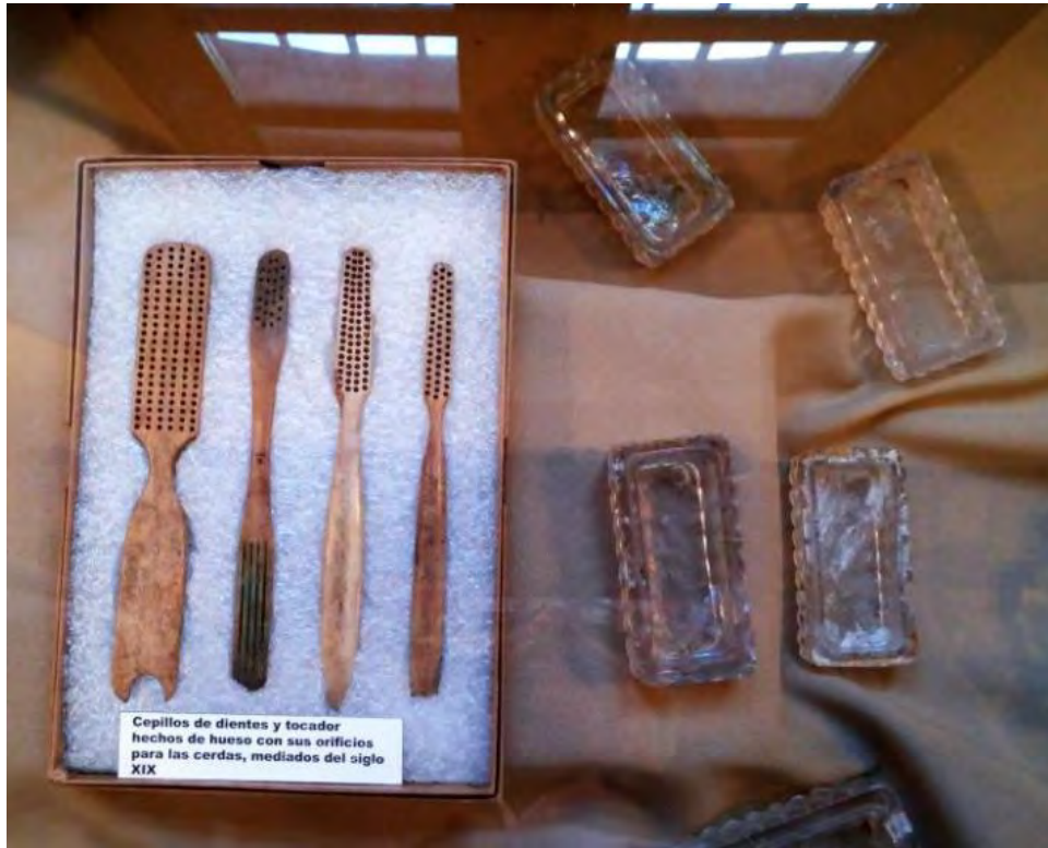
Cepillos dentales de hueso y cajas de vidrio para pasta dental