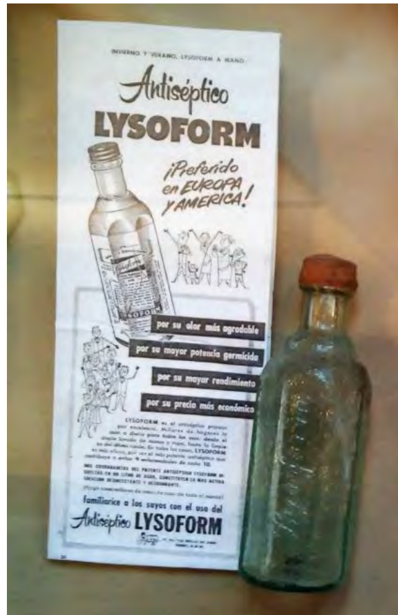
Antiséptico reconocido hasta la actualidad