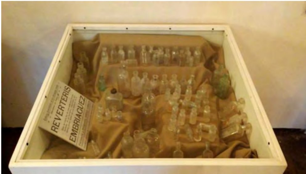
Vitrina con frascos para productos industriales