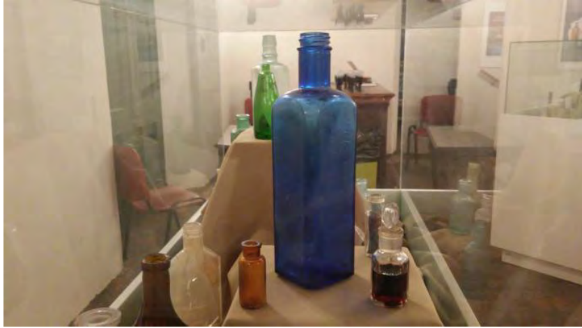
Vitrina de productos de farmacia y tocador