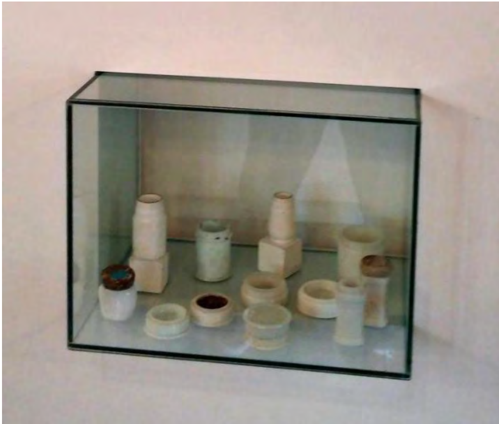
Productos de tocador en vidrio blanco