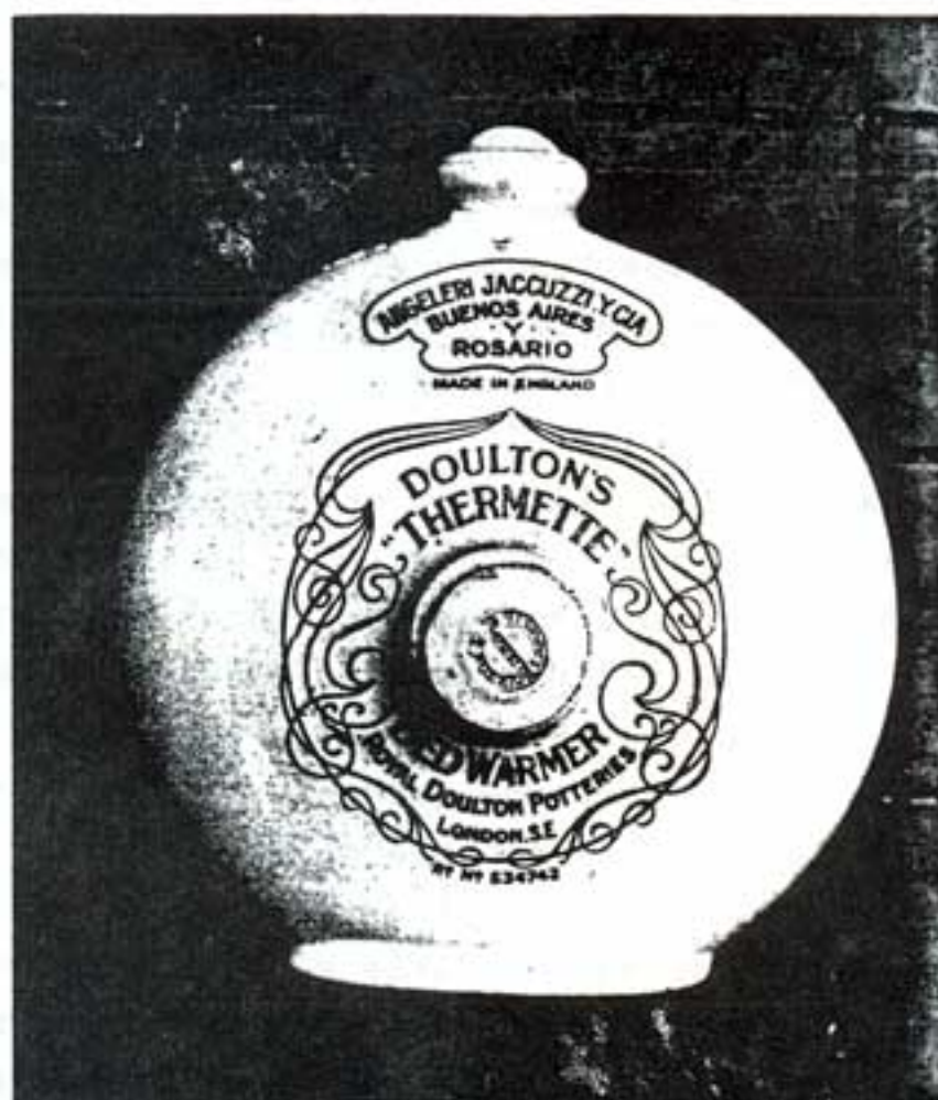
Dos de los tradicionales "calientapiés" fabricados en Inglaterra para su venta en Buenos Aires. Corresponden a los años 1890-1910.