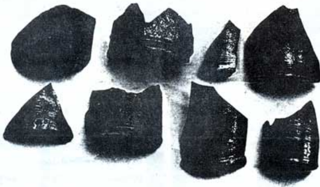
Recipientes de grés color café, utilizados para tinta, de proveniencia inglesa. Excavados en San Telmo, 1840-1880.