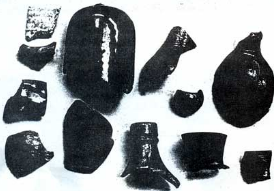
Diversos tipos de grés pertenecientes a botellas de ginebra, tinta, cerveza y frascos para conservas. En el ángulo inferior derecho picos de tinteros. 1860-1880.