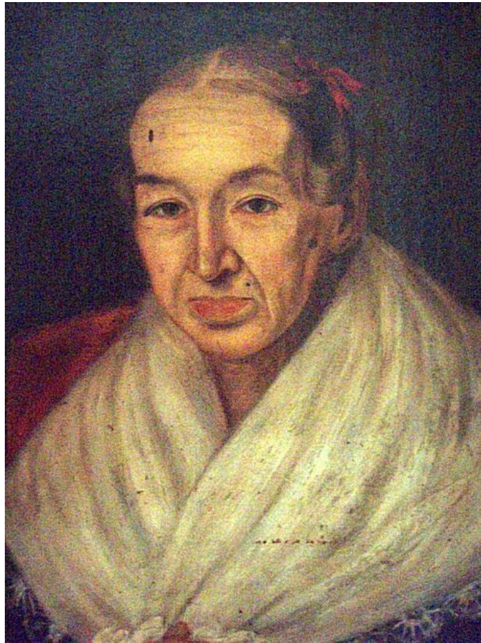
Antonia Dupuy de Villarino

la madre de Manuel Belgrano. De allí el dato conocido de que Castelli y Belgrano eran primos segundos.