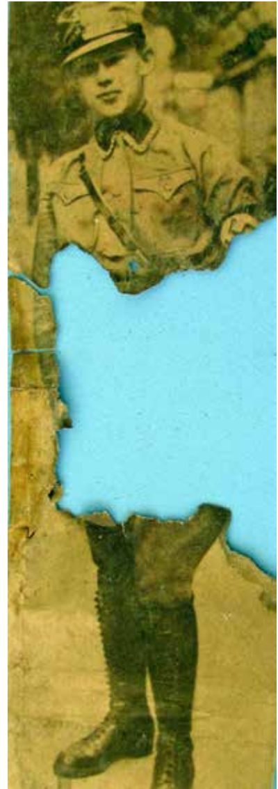
Izquierda: Detalle de la fotografía recortada de un diario de 1932, tal y como fue hallada durante la excavación. Derecha: Vista completa después de su limpieza y restauración.

La segunda imagen recuperada es una impresión en formato de postal, del tipo que abundó hasta fines de la década de 1950. La foto muestra a Adolf Hitler y a Benito Mussolini caminando juntos; el primero vestido de civil y el segundo con uniforme de gala y saludando. La restauración del pie de imprenta de la postal permitió observar que se trataba de un obsequio impreso por Ricardo Montalbetti e Hijos en la calle Chacabuco 2052, Valparaíso, Chile, y que los Montalbetti eran importadores de radios Marelli y de productos Italnova. La investigación sobre el origen de la imagen reve-