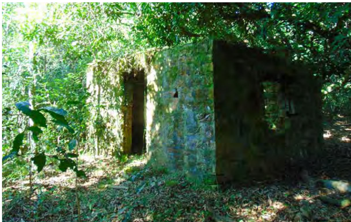
Vista de la construcción principal del grupo denominado “Casa de piedra”.