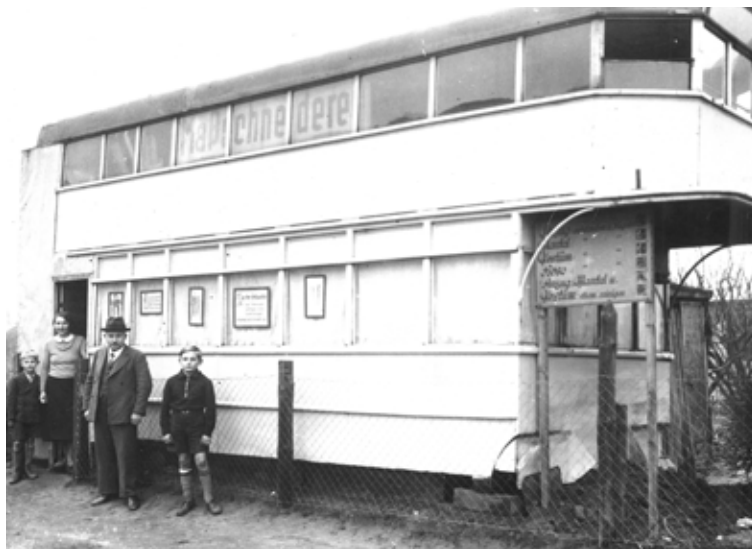
Ómnibus convertido en vivienda por un sastre de Berlín. Una ingeniosa respuesta ante la crisis y la persecución alemana, diciembre de 1934.

Por último, el Archivo General de la Nación rinde un sentido homenaje a las víctimas del holocausto durante el nazismo en la muestra que fue presentada en la sala de exposiciones: “Ana Frank, una historia vigente. De la dictadura a la democracia. La vigencia de los derechos humanos”. El exterminio de millones de judíos comenzó con conductas intolerantes: palabras, actitudes, incitación al odio, discriminación y racismo; conductas que deben ser combatidas resaltando la figura de Ana Frank como símbolo de la esperanza y como emblema de la memoria de las víctimas del nazismo.