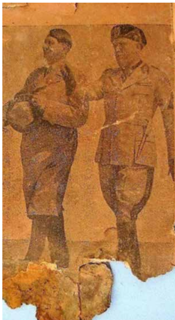
Detalle de la postal con la imagen de Hitler y Mussolini tomada en Venecia en 1934, tal y como fue hallada durante la excavación. Vista después de su limpieza y restauración.

Las excavaciones realizadas tanto en el interior de la casa como en sus alrededores permitieron la recuperación de un corpus de objetos que dan cuenta de un uso doméstico de dicho espacio durante la segunda mitad del siglo xx, ya que abundaban los restos de frascos y botellas de vidrio y latas metálicas de conserva, entre otros elementos de descarte. Sin embargo, el estudio de las características de la estructura puso en evidencia las limitaciones de su posible uso como vivienda dado lo exiguo del espacio interno y las potenciales complicaciones derivadas de la circulación por dos puertas. La presencia en el exterior de un fogón y un modesto banco de piedra contrastan con el importante pozo de agua íntegramente recubierto de piedras y con la base de un aljibe.