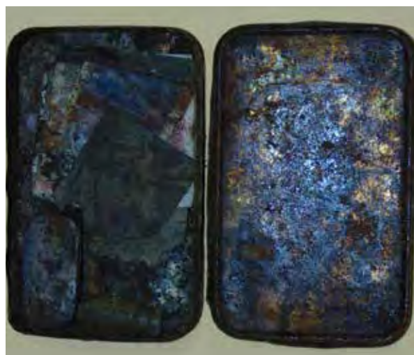
El contenido del recipiente metálico depositado en el muro de Casa de piedra, tal y como fue hallado al momento de ser abierto.

medida en que creció el poder del nazismo hitleriano; fueron prohibidas por el gobierno alemán, pero siguieron operando clandestinamente hasta que Hitler llegó al poder en 1932. Entonces, fueron reorganizadas y se les permitió volver a utilizar públicamente uniformes y emblemas.