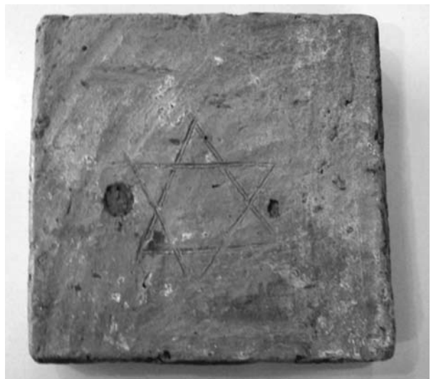
Figura 3. Baldosa cerámica del piso con la Estrella de David y un agujero para la vela.

Una vez muerto Tellechea se hizo, como correspondía para la sucesión, una tasación en el mismo año de 1812, la que describió la casa con detalle e incluye el piso de baldosas. La casa luego debió tener diversos usos quizás porque la familia no podía sostenerla y por los datos se infiere que debieron alquilarla. En 1827 comenzó un proceso de traspasos, ventas y contraventas de la propiedad, que unos años más tarde pasó a ser de un grupo de familias emparentadas: los Anchorena, los Bunge y los Peña. Viendo las escrituras la evolución es así: en 1843 la compró Carlos Bunge, en 1859 pasó a manos de Genara Peña (esposa de Nicolás Anchorena) asociada con Bunge. En 1874 pasó a Estanislada Arana de Anchorena. En 1884 falleció Nicolás Anchorena y lo sucedió su hijo del mismo nombre. Los Anchorena la usaron de comercio y únicamente en todos esos años Carlos Augusto Bunge vivió allí, quien si bien era hijo de un pastor luterano su fe era la evangelista, religión a la que le dedicó gran parte de su dinero. Pero la secuencia de traspasos de la propiedad y en especial la aparición de escrituras de deudas e hipotecas más los testafierros que luego declaraban que compraban para los mismos a quienes vendían para blanquear documentos, es raro y muestra maniobras económicas que sólo servían