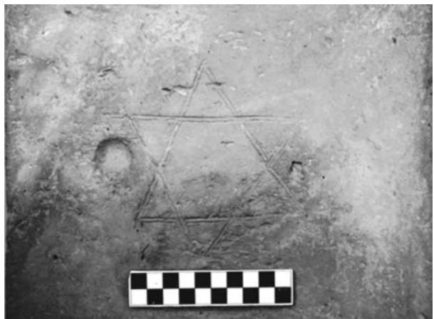
Figura 4. Detalle de la Estrella de David y el agujero para una vela grabados en la baldosa.

Todo esto nos abre interrogantes ya que si tenía la intencionalidad simbólica que presumimos, debió hacerse en el fabricante, luego hornearse y dejarla enfriar, y después trasladarla a la ciudad para ser luego colocada en el piso. El tema es complejo en ese Buenos Aires colonial ya que implica muchas operaciones que ocultar y por lo tanto